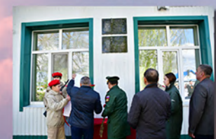
Мемориальная доска С. В. Большакова в г. Янаул