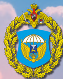
Эмблема 76-й десантно-штурмовой дивизии