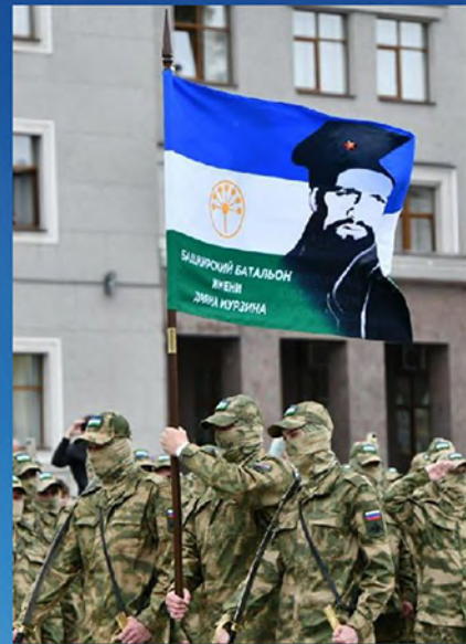
Знамя 1-го мотострелкового батальона им. Даяна Мурзина