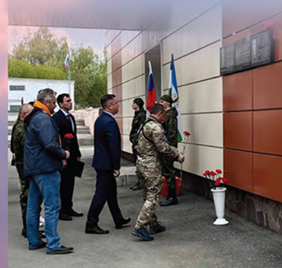
Мемориальная доска М. Р. Рыбакова в г. Белорецк