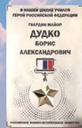
Мемориальная доска Дудко Б.А. в г. Бирске