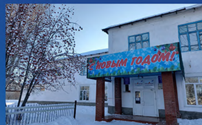
Школа № 2 имени Героя России Алмаза Сафина в с. Раевский