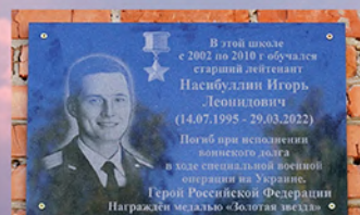
Мемориальная доска Насибуллина И.Л. с. Старый Варяш