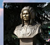
Бюст Насибуллина И.Л. в г. Янаул