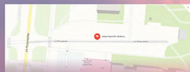
Улица Героя России Большакова в г. Иваново.