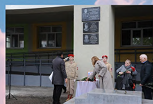
Мемориальная доска С. В. Большакова в г. Елабуга