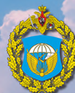
Эмблема 98-й воздушно-десантной дивизии

2 февраля 2024 г. войска противника попытались штурмовать позиции батальона Рыбакова. Капитан, для отражения атаки, использовал засады из противотанковых расчётов, минометный и артиллерийский огонь, а также крупнокалиберные пулеметы. Получив столь сильный отпор, противник отступил на исходные позиции. Батальон сохранил за собой занимаемые рубежи, но гвардии капитан пал смертью храбрых.