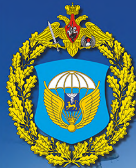
Эмблема 76-й десантно-штурмовой дивизии