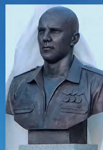
Бюст А.М. Сафина в г. Новосибирск