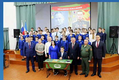
Парта Героя в школе №12 г. Октябрьский